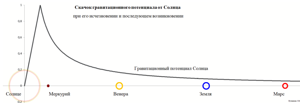
Рис.1 Распространение провала гравитационного потенциала при исчезновении и появлении Солнца вновь.

Что при этом, собственно говоря, движется в пространстве, «отключая» притяжение планет? Очевидно, это своеобразный «фронт» гравитационного потенциала. Напротив, если затем Солнце вновь мгновенно окажется, возникнет на своём прежнем месте, то также возникнет новый фронт гравитационного потенциала, который вновь пробежит от Солнца на бесконечность, вновь «захватывая» своим воздействием планеты одну за другой. То есть, в этом гипотетическом примере в пространстве «пробежит» своеобразный провал гравитационного потенциала. На рисунке это можно изобразить следующим образом в виде анимации: